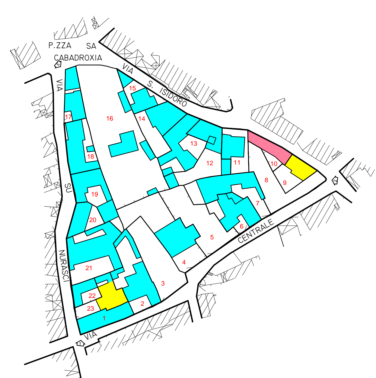
CLASSI DI TRASFORMABILITA' SCALA 1:1000