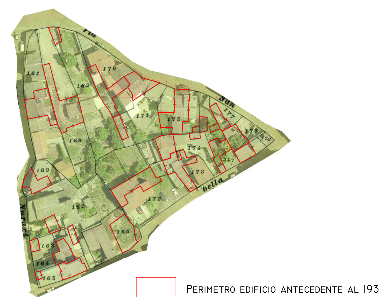
SOVRAPPOSIZIONE TRA ORTOFOTO E CATASTALE DEL 1939 SCALA 1:1000