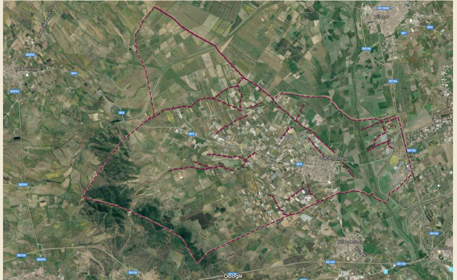
Decimoputzu _Foto satellitare